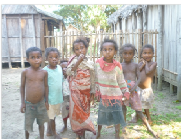
(3) Un groupe d'enfants de la commune d'Ambinanibe, Fort-Dauphin, Région Anosy – commune rurale faisant partie des zones d'intervention du projet lors d'une mission d'évaluation réalisée à travers l'approche des missionnaires du Président du Fokontany et de la communauté locale. Le projet contribue à une diversification des sources de revenus pérennes pour les populations rurales plus démunies tout en améliorant la sécurité alimentaire.