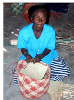
(4) Un autre exemple d'une chaîne de valeur rurale sélective qui est appuyée par le projet : Une femme faisant partie de la communauté appuyée, filière artisanat – fibres végétales. Le projet répond à des besoins spécifiques des bénéficiaires cibles et prend en compte de l'aspect genre en soutenant l'intégration socio-économique des femmes.