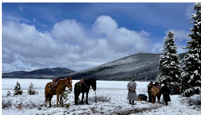
Хан Хэнтийн ТХГ-ын байгаль хамгаалагчид

Байгаль орчин, аялал жуулчлалын яамтай хамтран тусгай хамгаалалттай газар нутгийн эрх зүйн орчныг бэхжүүлнэ. SPACES I нь тусгай хамгаалалттай газар нутгийн тухай хуулийн шинэчлэлийг дэмжиж байсан бол одоо тус шинэчлэл нь үндэсний болон тусгай хамгаалалттай газар нутгийн нарийвчилсан зохицуулалтаар нотлогдсон байна. Энэ нь хамтын менежмент, бие даан санхүүжүүлэх механизмыг бэхжүүлэх замаар тусгай хамгаалалттай газар нутгийн менежментийг илүү үр ашигтай болгоно.