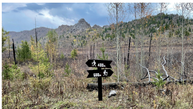
GIZ-ийн дэмжлэгтэйгээр Хан Хэнтийн ТХГ-т аяллын маршрут байгуулав