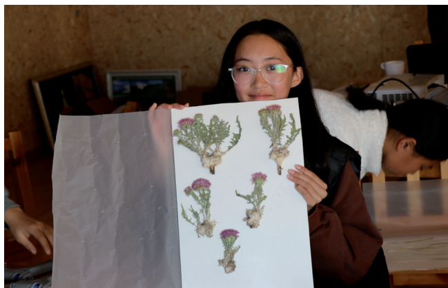
Ховд аймгийн ЕБС-ийн эко клубүүд Байгаль орчны боловсролын хөтөлбөрт хамрагдав

Байгаль орчны мэдээлэл сургалт сурталчилгааг (БОМСС) сайжруулах арга аргачлалыг тусгай хамгаалалттай газарт туршиж, үндэсний түвшинд ашиглах боломжийг бүрдүүлнэ. Төсөл нь тусгай хамгаалалттай газар нутгийн захиргааны ажилтнуудад БОМСС-ын асуудлаар зөвлөгөө өгч, байгаль хамгаалагчдад болон хүүхэд залуучуудад зориулсан сургалтын хөтөлбөрийг боловсруулна. Энэ бүх ажил нь ТХГН-ийн шинэ хуулийг хэрэгжүүлэхэд дэмжлэг үзүүлэхээс гадна олон нийтийн дунд ТХГН-ийн талаарх мэдлэгийг нэмэгдүүлж байгаль орчныг хамгаалахад хувь нэмэр оруулна.