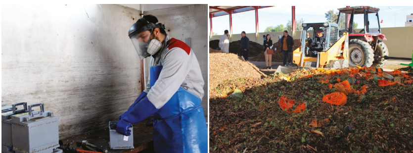
1- Recyclage et valorisation des batteries au plomb usagées 2- Unité-pilote de compostage située sur la commune de Kairouan 3- Sensibilisation sur l'upcycling lors de la soirée de l'environnement 4- Les décideurs réunis pour une vision commune de l'EC

À la suite des accords de coopération technique Tuniso-Allemande, le BMZ a mandaté la GIZ avec l'appui du MEnv et l'ANGed pour l'exécution du projet Protect, qui a pour objectif principal l'amélioration de la gestion des déchets solides en intégrant les aspects de l'EC et du CC, tout en favorisant la création d'emplois et le respect du genre.