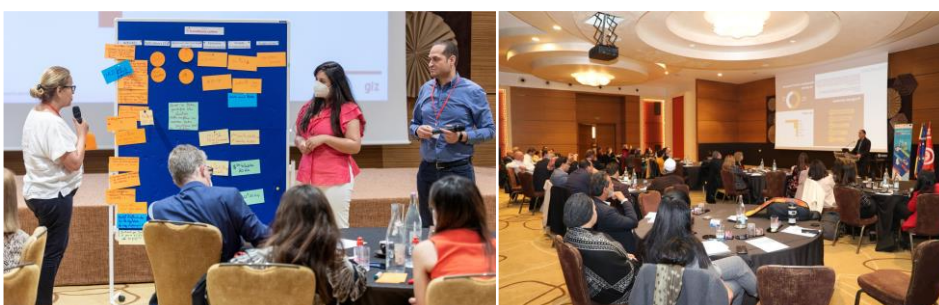
Photo à gauche prise lors de l'atelier de lancement du projet CQE