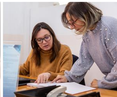
الصور (الصفحة الأولى)

صورة INNO-DEV لـ "حضانة المؤسسات في الجزائر" و "صندوق ضمان القروض للمؤسسات الصغيرة" (FGAR) « و المتوسطة