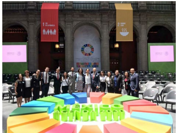
Vertreter des Büros des Staatspräsidenten und das Team der Initiative Agenda 2030 bei der Einrichtung des Nationalen Rats für die Agenda 2030 im Regierungspalast in Mexiko-Stadt.

Die für die Umsetzung der Agenda 2030 eingerichtete Abteilung ist für die Koordinierung der Umsetzungsprozesse und den Aufbau einer Nachhaltigkeitsarchitektur verantwortlich. Wichtiger Bestandteil ist der Nationale Rat der Agenda 2030, der im April 2017 von dem mexikanischen Staatspräsidenten offiziell eingerichtet wurde.