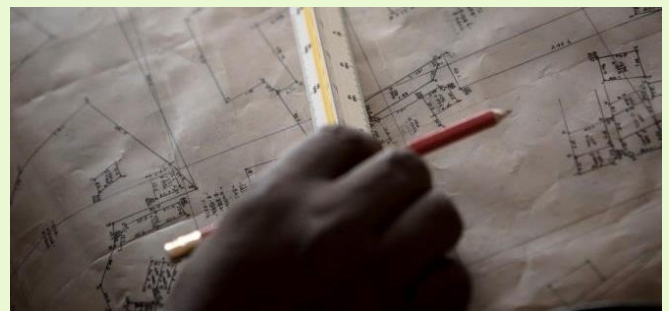
Abbildung: Erstellung eines Katasterplans in Uganda

Das Vorhaben Verantwortungsvolle Landpolitik in Uganda setzt hier an, um die Landrechte der ländlichen Bevölkerung auf systematische Art und Weise zu dokumentieren. In einem ersten Schritt klärt das Vorhaben die Zielbevölkerung über ihre Rechte und Möglichkeiten auf, ihre Landrechte dauerhaft zu schützen. Ein besonderes Augenmerk liegt hier auf Frauenrechten, denn Landrechte werden oft nur an die männlichen Nachkommen der Familie vererbt. In einem zweiten Schritt werden auf Dorfebene systematische Landinventuren erstellt. Hierbei werden die einzelnen Grundstücke digital vermessen und die notwendigen Informationen über die Eigentümerinnen und Eigentümer sowie Nutzerinnen und Nutzer gesammelt.