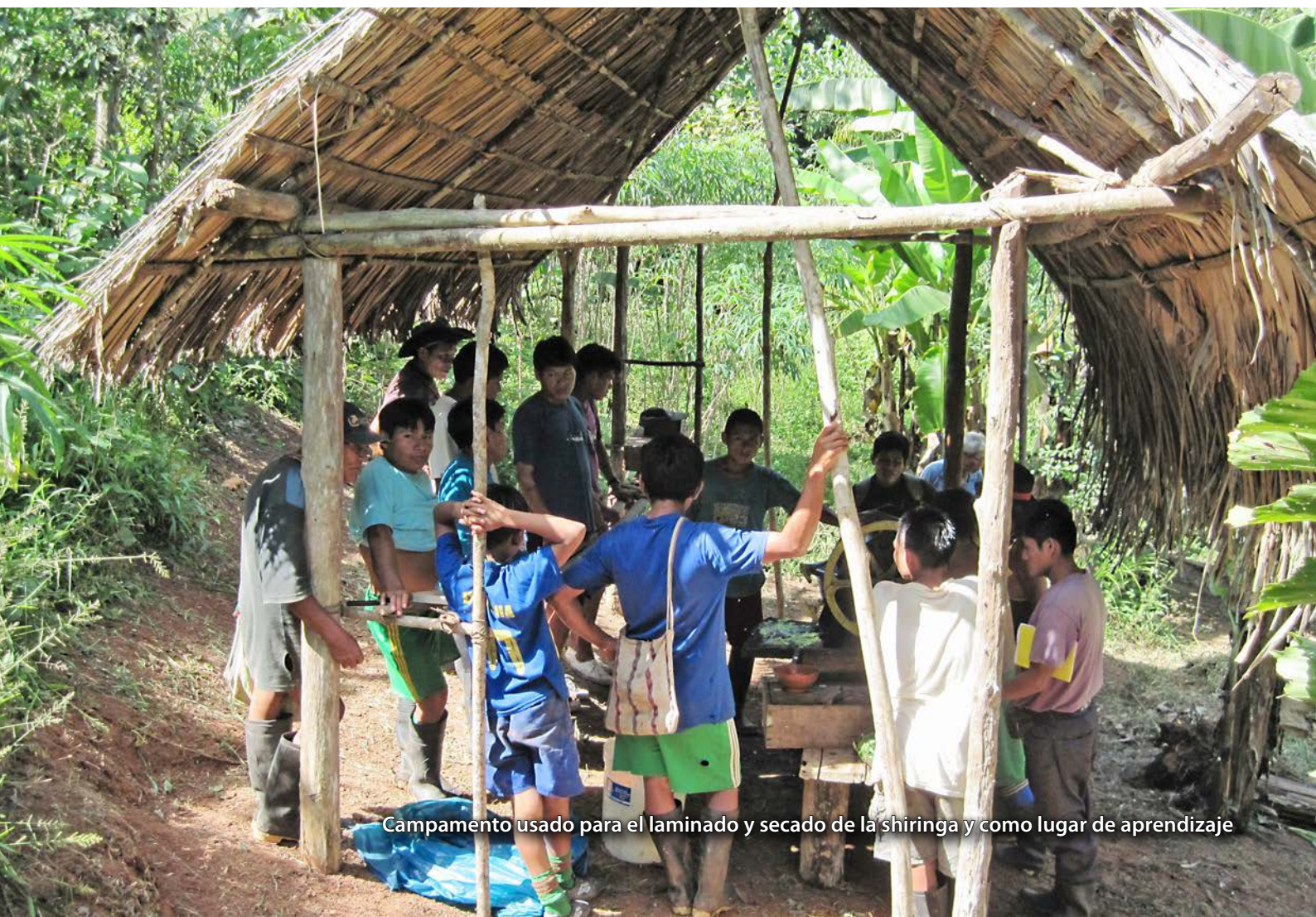
Campamento usado para el laminado y secado de la shiranga y como lugar de aprendizaje