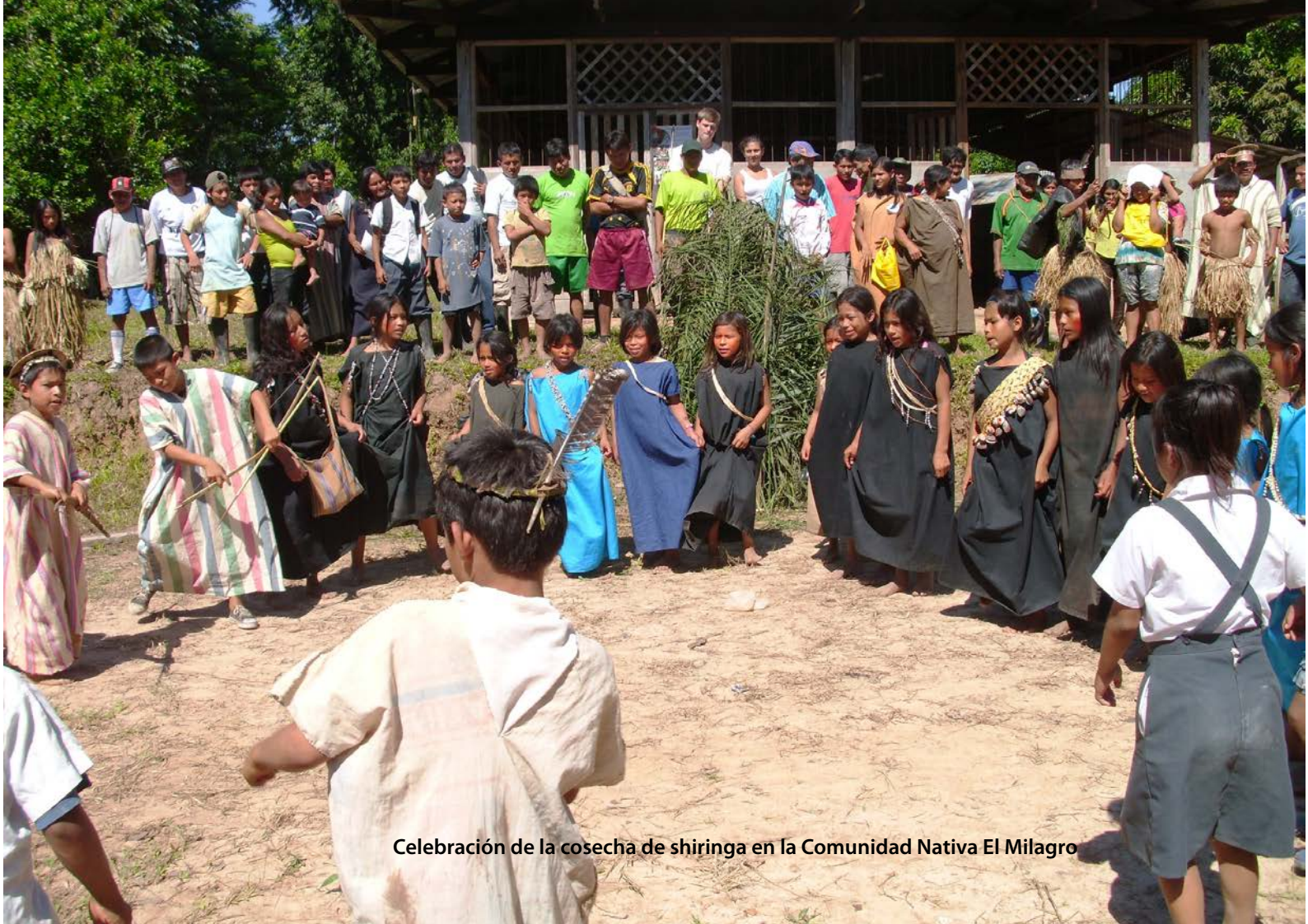
Celebración de la cosecha de shiranga en la Comunidad Nativa El Milagro