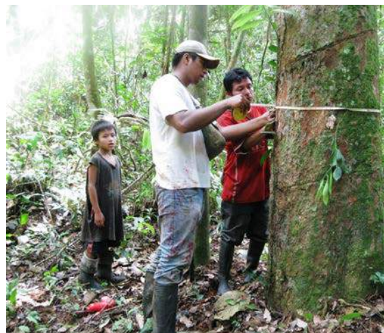
Georeferenciación y cálculo del diámetro de los árboles de shiringa