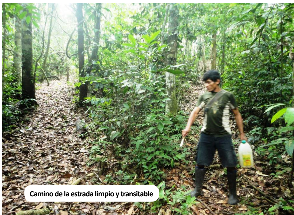
Camino de la estrada limpio y transitable

La actividad del mateo y diseño están descritas en la ficha técnica “Aprovechamiento del caucho silvestre por las comunidades nativas en la selva amazónica del Perú” (FiTe03-EISira-GIZ)