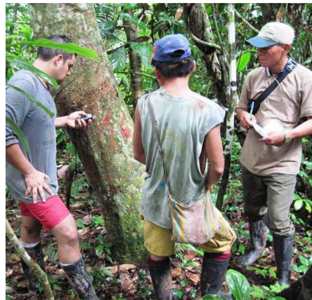
Haciendo inventario para el Plan de manejo

Herramientas básicas utilizadas: hacha, machete y lima son herramientas que las comunidades poseen siempre, como implemento personal de su trabajo en las chacras, por lo cual no entrarán a los costos.