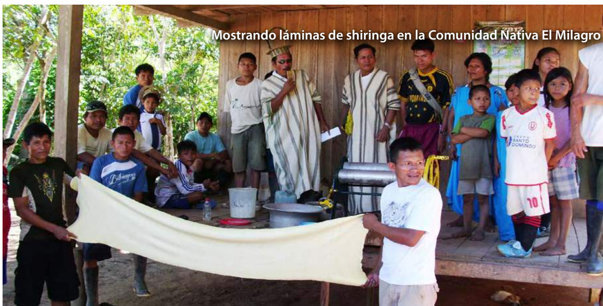
Mostrando láminas de shiringa en la Comunidad Nativa El Milagro