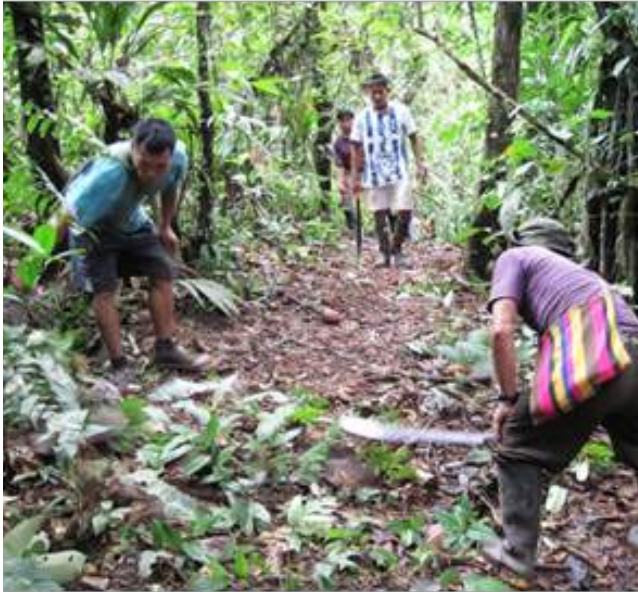
Shiringueros haciendo la limpieza del camino de las estradas