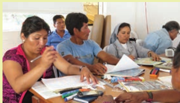
Taller de Calendarios de la Biodiversidad. Pto. Inca