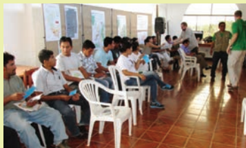
Taller de análisis de la Vulnerabilidad. MARISCO. Pto. Inca