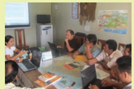
Taller de revisión del Régimen Especial (RE) con ECAs y SERNANP