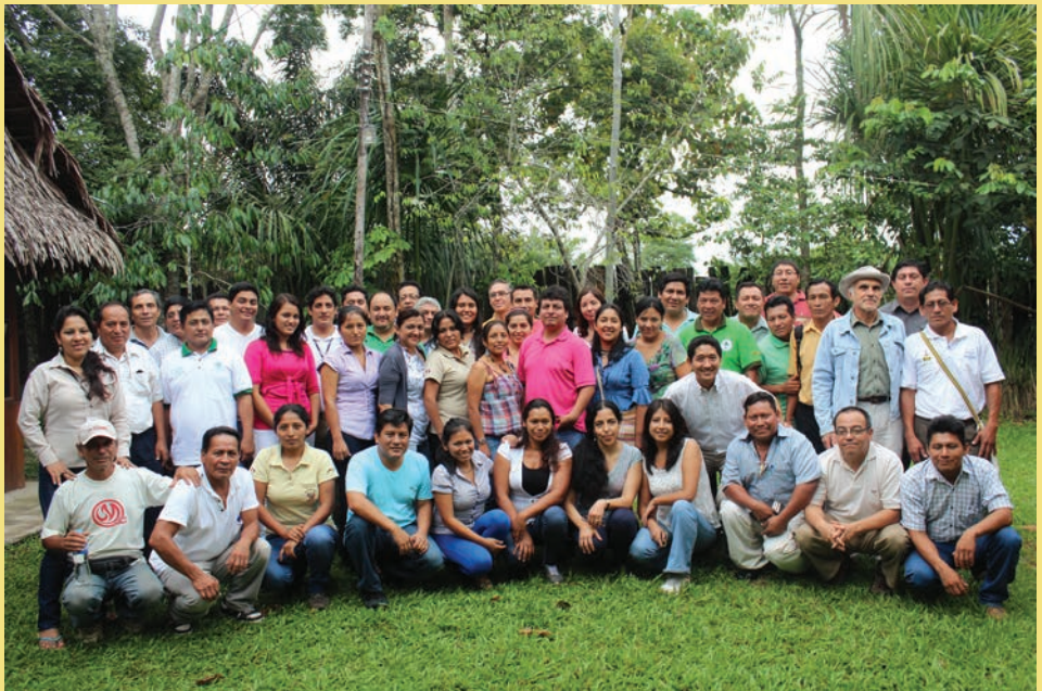
Equipo de trabajo del Proyecto Co-Gestión Amazonia Perú junto con una parte del personal de contraparte

Para que las comunidades puedan implementar 60.000 has de sus planes de manejo aprobados con el apoyo del Proyecto, el CoGAP acordó en 2013 la implementación en las comunidades de Nuevo Paraíso (15.000 has), de Quipachari (4.706 has), Séptimo día Santa Fe de Aguachini (1.247 has), San José de Azupí (671 has), Loreto (858 has) y Enoc Flor de Un Día (739 has) – total 23.221 has.