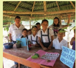
Feria de Biodiversidad. Comunidad El Naranjal