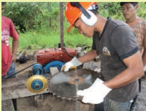
Aprendiendo a procesar la madera. Alto Aruya

En lo referente a los instrumentos mencionados para mejorar la gestión de áreas protegidas (identificación y señalización de limites, vigilancia comunitaria, gestión de conflictos, educación ambiental, monitoreo de la biodiversidad) se ha podido avanzar sobre todo en el de la “educación ambiental”. El proyecto publicó la “Guía para contextualizar la educación ambiental intercultural”, que contiene sugerencias conceptuales y prácticas para incorporar los saberes locales sobre la biodiversidad en la curricula escolar. Y se hizo prácticas de 13 ferias de biodiversidad con 17 comunidades con sus alumnos y padres de familia, un total de aprox 700 alumnos que participaron junto con sus profesores en estas ferias, que contribuyen a fortalecer su identidad cultural. En varios talleres junto con docentes y padres de familia se ha podido elaborar diferentes calendarios de biodiversidad. Con los UGELe involucrados gestionamos convenios para institucionalizar estas practicas de las ferias y calendarios de biodiversidad en la curricula escolar.