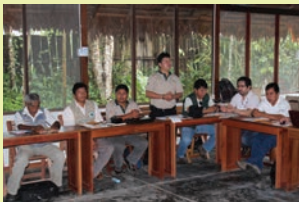
Taller de Planificación. Equipo del Proyecto