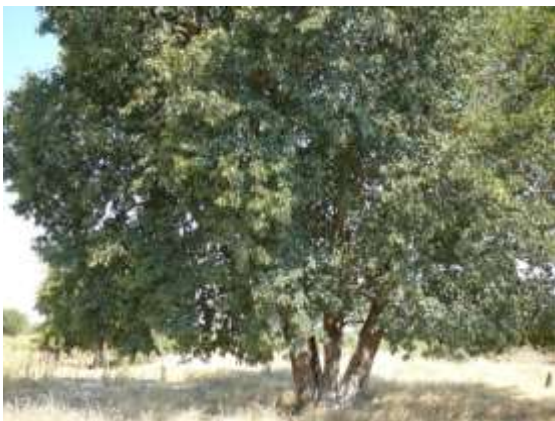
Baikiaea plurijuga .

Utilisation : Baikiaea est réputé pour son bois dur et lourd.