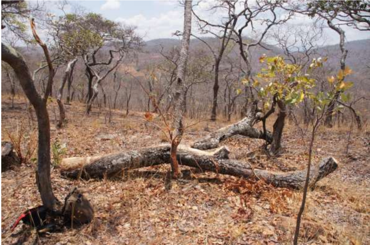
Forêt à Baikiaea pendant la saison sèche.