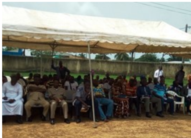
Représentants des villageois lors d'une séance publique de sensibilisation à la mairie de Taï en mars 2017

Dans le cadre d'un Comité national de pilotage actif, les autorités en Côte d'Ivoire soutiennent la désignation d'un corridor écologique entre le Parc national de Taï et la forêt de Grebo.