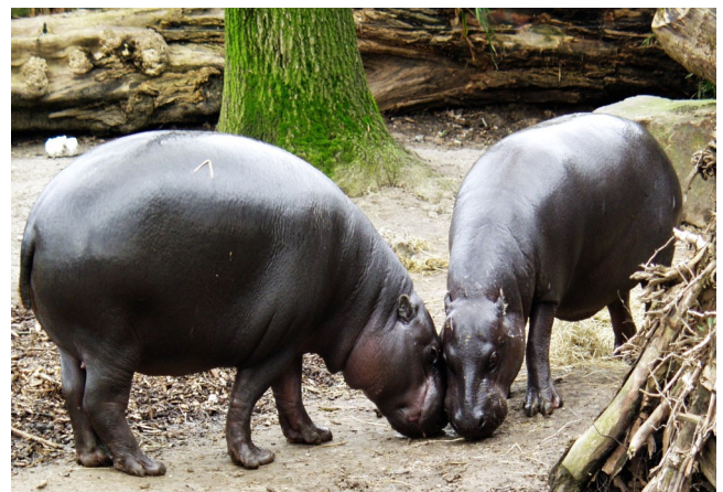
Le Parc national de Sapo abrite la plus grande population d'hippopotames pygmées du Liberia

Cela devrait se traduire notamment par la création de corridors et zones de connectivité écologique, d'une part, entre le PNT et la forêt de Grebo (proposée partiellement au classement en Parc national de Grebo-Krahn) et, d'autre part, entre cette forêt de Grebo et le PN Sapo.