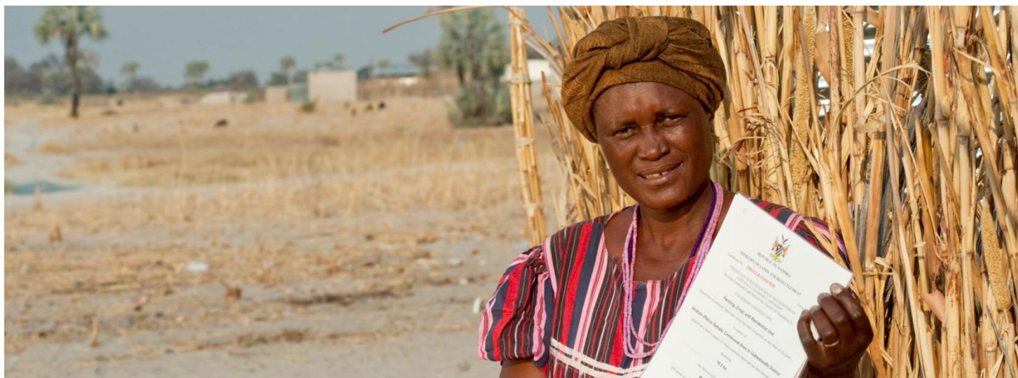
Une agricultrice de Namibie présente un certificat de droits fonciers