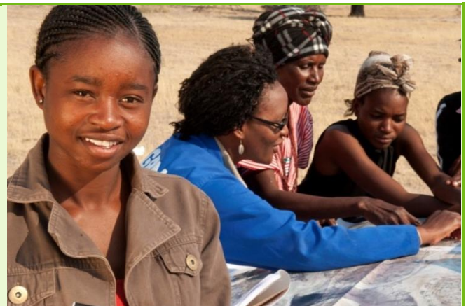
Modélisation participative des parcelles de terrain en Namibie.

SLGA soutient activement l'établissement et ce cursus doctoral. Avec le support de l'université technique de Munich (TUM) une révision du programme d'étude a été accomplie en 2016. Un nombre de recommandations ont été formulées afin d'ajuster le programme du cursus aux normes internationales et en accord avec les directives de NELGA. Par ailleurs, à l'avenir, la TUM va soutenir le cursus doctoral par l'organisation de séminaires ponctuels et en co-supervisant un nombre de thèses. En outre, par l'intermédiaire du DAAD, des bourses seront allouées pour le nouveau programme d'étude de Bahir Dar afin d'en faire bénéficier à des étudiants venant de toute l'Afrique. Grâce à cela, de jeunes Africains, ainsi que la coopération et le partage de connaissance entre les universités africaines seront encouragés.