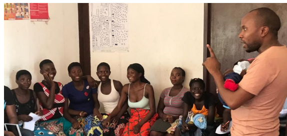
La coopération avec des organisations non gouvernementales internationales, par exemple Aidspace et Frontline AIDS, a contribué à améliorer la gestion des risques chez les bénéficiaires et à prévenir l'utilisation non conforme des fonds.

Dans le cadre d'une étude de pays, Aidspan a examiné les possibilités de mieux associer les cours des comptes nationales au contrôle des programmes nationaux du Fonds mondial et a organisé une table ronde permettant un échange de connaissances entre les institutions suprêmes de contrôle des finances publiques. Entre-temps, les cours des comptes du Kenya, du Rwanda et du Ghana réalisent elles-mêmes des audits des programmes du Fonds mondial.