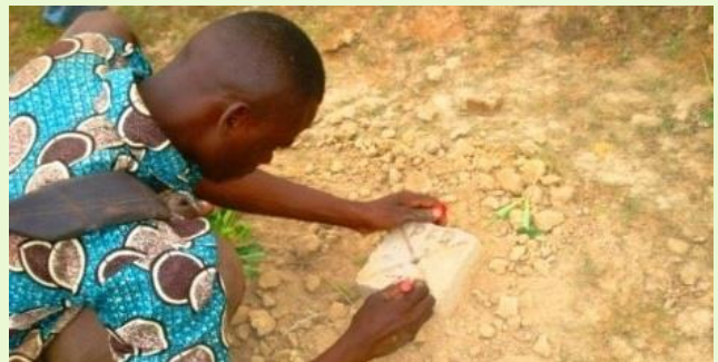
Abbildung: Vermessung in Benin

Zur Förderung verantwortungsvoller Agrarinvestitionen wurde eine Nationale Charta in Kooperation mit den Partnern verabschiedet. Die Charta beruht auf den Freiwilligen Leitlinien für die verantwortungsvolle Verwaltung von Boden- und Landnutzungsrechten der Ernährungs- und Landwirtschaftsorganisation Vereinten Nationen.