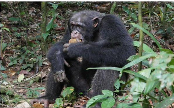
Chimpanzé dans le Parc national de Taï