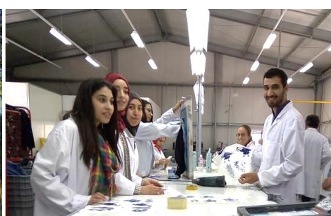
De gauche à droite : Utilisation de moustiquaires dans une palmeraie de Zaafrane (Kébili) Formation en sérigraphie pour des jeunes à Monastir