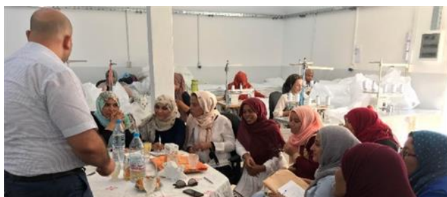
Rencontre entre les institutions partenaires du projet « moustiquaires » et les femmes entrepreneures.

20 femmes de Kébili et 20 femmes de Tozeur ont créé leur propre entreprise de confection. Employant aujourd'hui près de 120 ouvrières, elles se sont regroupées pour ouvrir des locaux de confection dans plusieurs délégations des deux régions, faisant preuve de dynamisme et de persévérance face aux défis rencontrés.