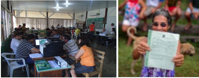
Fotos do Mutirão Integrado em Rondônia de Regularização Fundiária e Ambiental (assessoria aos proprietários rurais e instrumentos de georeferenciamento).