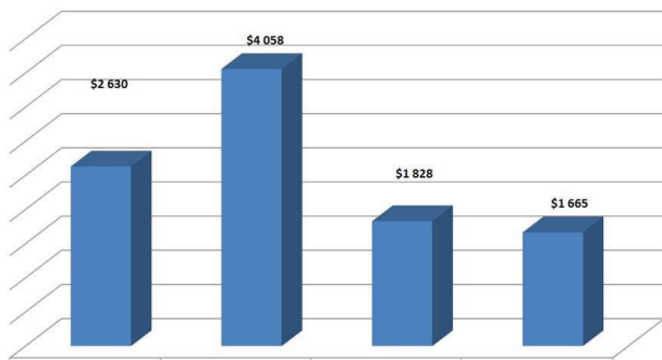
Средний размер займов, выданных микрофинансовыми организациями Таджикистана в IV квартале 2011 г.

извлечь выгоду из сотрудничества с коллегами из Азии, Америки и Европы, где уже пройдены этапы развития данного сектора. В то же время, существующие нормативно-правовые базы, организационное делопроизводство, а также использование русского языка делают похожими страны ЦА друг на друга. Вследствие этого, программа поддерживает схемы сотрудничества в отношении новых продуктов и политики в Кыргызстане, Таджикистане и Узбекистане.