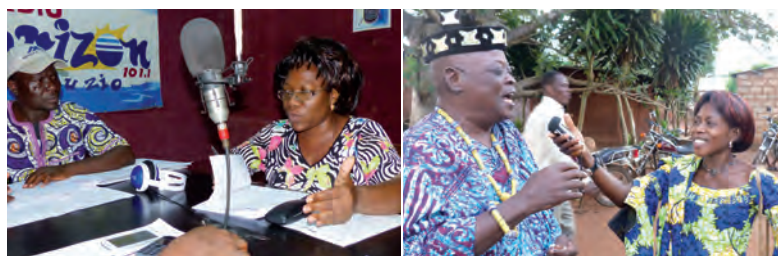
À gauche : Emission radiophonique interactive sur « l'élaboration participative du budget communal », novembre 2013, Radio Horizon, Tsévié avec la Directrice Exécutive de l'ONG FIADI et un journaliste dans l'enceinte de la Radio Horizon. À droite : Emission Radio Mobile sur le thème « Gestion du cimetière municipal », juillet 2014, Tsévié, avec une journaliste de la Radio Horizon et le Chef de Quartier du Daviemondji.

Le programme renforce les journalistes de radio en ciblant leurs capacités techniques ainsi que leur rôle d'intermédiaires entre la population et les élus politiques. A travers des formations, les journalistes élargissent leurs connaissances journalistiques et élaborent des formats d'émission intégrateurs et proches des citoyens. En participant à des événements politiques tels que la