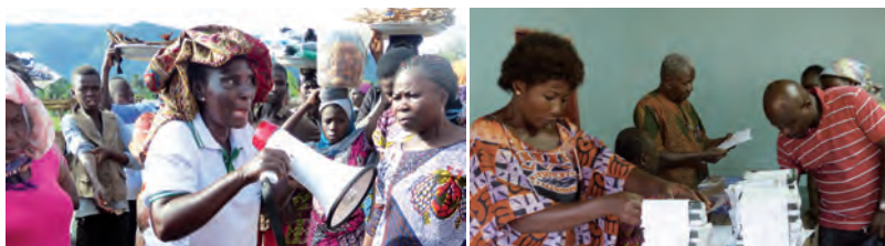
Photo à gauche : des femmes du marché de Kpalimé incitent à la participation à la « cascade » ; à droite : des citoyens et citoyennes de Kpalimé s'informent sur la citoyenneté moderne.

Certains thèmes ont entretemps été discutés lors de ces séances de quadrilogue, par exemple, les problèmes de transport public et de construction de route ainsi que l'organisation des systèmes