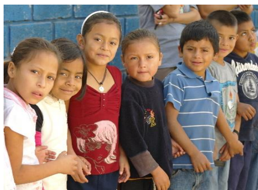
Niños escolares y padres de familia del occidente de Honduras.