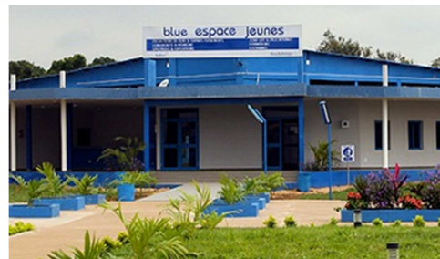
Blue Zone à Lomé Cacavéli