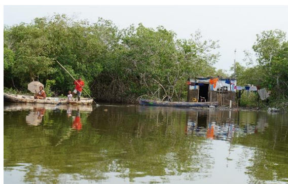
Los manglares son restaurados junto con la comunidad