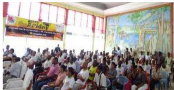
Vue d'ensemble des membres de la Plateforme miel de Boeny lors de la Journée de réflexion "Apiday" en Décembre 2015.

techniques, d'accélérer les résultats et d'espérer plus d'impacts.