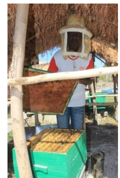
Un apiculteur faisant une visite de sa ruche

La stratégie adoptée par la Plateforme Miel, avec l'appui de PAGE est de rendre professionnels les apiculteurs à l'issue duquel le nombre de ruches peuplées et productives devrait augmenter. En outre, le miel produit doit être de bonne qualité et reflète la