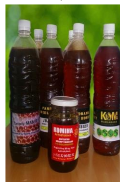
Miel de mangrove, de palissandre et de jujubier, produits à Boeny

1. Après les formations techniques, les apiculteurs ont été dans un premier temps encouragés à confectonner et à peupler des ruches par leur propre moyen et effort, avant que PAGE