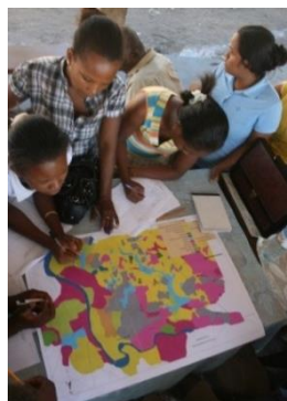
Dans la commune de Betsako, l'intervention du PAGE/GIZ a aussi favorisé la participation des femmes.

En 2013, la commune de Betsako a élaboré son SAC et mis en œuvre les différentes étapes avec l'accompagnement du PAGE/GIZ. Après validation du projet par le conseil communal, le Maire a constitué une équipe technique, composée à majorité par de femmes, et a mobilisé les ressources financières nécessaires. Formée et coachée par un binôme de consultants locaux pris en charge par PAGE/GIZ, l'équipe technique s'est occupée de la collecte et analyse de données, de la consultation de la population au niveau villageois pour la cartographie participative et de l'élaboration du scénario pour la commune. Après consultation des STD au niveau régional, le conseil communal a validé le SAC en mai 2013.