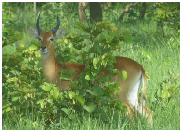
Cobe de Buffon au Parc national de Comoé

Malgré une pression croissante sur ses ressources, le management du Parc national de Taï a pu maintenir le statut d'héritage mondial de la nature à l'aide de ses partenaires, dont la GIZ. Le parc compte aujourd'hui parmi les forêts tropicales humides les mieux préservées d'Afrique de l'Ouest. Près de 5.000ha de surfaces illégalement conquises par l'agriculture ont pu être récupérées, le plan de gestion du parc a été en grande partie mis en œuvre et l'infrastructure