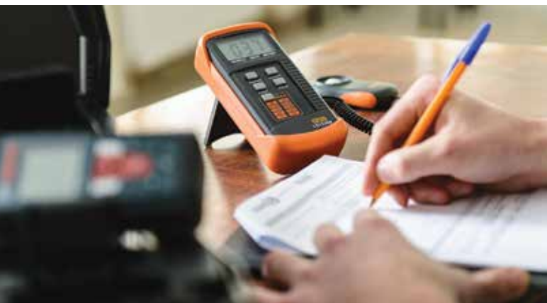
Енергоаудит в будівлі Міністерства регіонального розвитку, будівництва та житлово-комунального господарства

Після підписання у 2014 році Угоди про асоціацію з ЄС та членства в Європейському енергетичному співтоваристві, Україна взяла на себе зобов'язання щодо проведення важливих енергетичних реформ. Директиви ЄС стосовно енергетики повинні поступово впроваджуватись у національне законодавство. Процес реформування вже має перші результати: в квітні 2015 року парламент прийняв закон щодо діяльності енергосервісних компаній, а потім, у червні 2017 року, закон про енергоефективність у будівлях. Проте, досі цей процес просувався дуже повільно: майже всі терміни реалізації часткових реформ вже перевищені на кілька років, нормативні акти та інші правові норми, необхідні для впровадження нових законів, приймаються фрагментарно. Інституційні обов'язки незрозумілі, а працівники органів влади не мають досвіду та ноу-хау для просування процесів реформ.