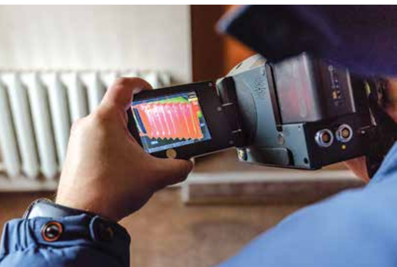
Перевірка радіатора за допомогою термографа

Ці та інші навчальні курси допоможуть в довгостроковій перспективі скоротити енергоспоживання та втрати по всій країні та покращити безпеку енергопостачання завдяки скороченню енергоімпорту. Крім того, що не є менш важливим, це також покращує і стан довкілля.