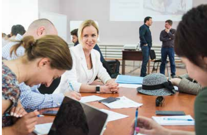
Працівники Міністерства регіонального розвитку, будівництва та житлово-комунального господарства навчаються та обмінюються ідеями

Для впровадження рекомендацій щодо енергоаудитів і енергопостачання в законодавство, GIZ готує так звану Білу книгу критеріїв якості та сертифікації з урахуванням умов та можливостей у країні, а також прикладів європейських країн.