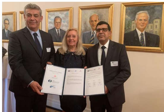
Signature de l'accord de coopération avec l'Association des pays euro-méditerranéens et arabes (EMA) le 13.02.2020 à Berlin

Sélection de quelques projets d'investissement en Tunisie accompagnés de TIA