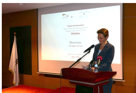
De gauche à droite : Paysage à Djelfa ; Lancement officiel du projet ClimGov