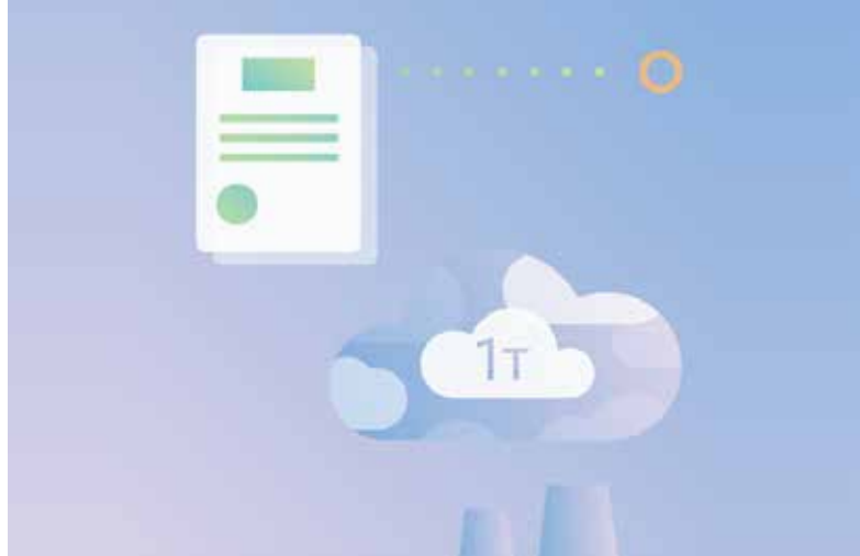
На кожну тонну викидів має бути квота

СТВ вважається прозорим, ефективним і найбільш економічно доцільним інструментом скорочення викидів. Механізм передбачає торгівлю квотами: підприємства, які знизили викиди парникових газів, можуть продати свої невикористані квоти підприємствам, що перевищили норми квот на викиди. Так, на ринку в процесі торгівлі формується ціна на квоти, а відповідно й на викиди. Дохід, що формується з продажу невикористаних квот, може бути використаний компаніями для купівлі чи часткового рефінансування зелених технологій. Таким чином, СТВ забезпечує вигоди не лише для підприємств, а й для населення та навколишнього середовища в цілому.