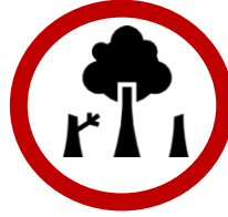
Rodung von Wäldern