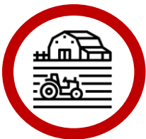
Landwirtschaft/ Verseuchung von Böden

Der One-Health-Ansatz schließt unter anderem Eingriffe des Menschen in folgenden Bereichen ein: