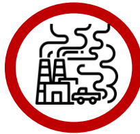
Luft- und Wasserverschmutzung