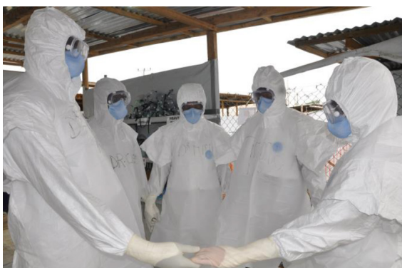
Image : Volontaires médicaux dans un centre de traitement d'Ebola à Monrovia, Liberia

Le précédent projet de même nom a eu un impact positif sur la protection de la population de la CEDEAO contre les épidémies en accroissant la communication adaptée aux menaces sanitaires. Les mesures de soutien mises en place par l'Organisation Ouest Africaine de la Santé (OOAS) pour les pays membres de la CEDEAO en matière de prévention et de contrôle des pandémies ont également été améliorées. En outre, le système d'analyse de la surveillance et de la gestion de la réponse aux épidémies SORMAS a été introduit au Nigeria et au Ghana où il est également utilisé pour le signalement des cas de COVID-19 au cours de la pandémie actuelle. Le programme a fait preuve d'une grande flexibilité pendant l'épidémie en facilitant la mise en œuvre au sein des pays, des plans d'urgence régionaux et nationaux pour la COVID-19, ce qui a contribué à une réponse diligente à la pandémie au niveau national.