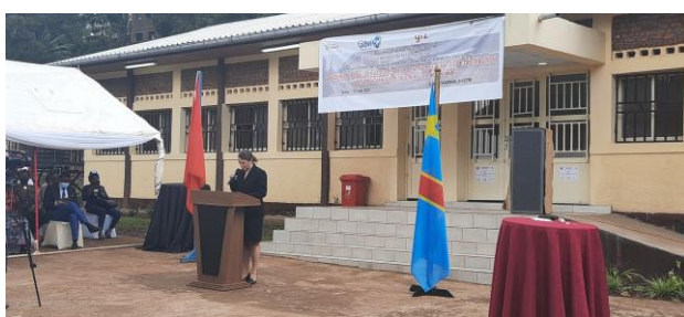
Lancement officiel des activités de la CDR

La faible couverture sanitaire, la mauvaise qualité des soins et le manque de médicaments comptent parmi les plus grandes menaces pour la santé de la population congolaise. Le nombre réduit d'établissements respectant les normes sanitaires nationales ne permet pas de couvrir convenablement l'étendue géographique du pays et le faible niveau d'équipement de ces établissements les empêche de proposer un paquet conforme de soins de base et complémentaires. Les fonds issus de la vente des médicaments sont utilisés pour payer le personnel, plutôt que pour le réapprovisionnement. De plus, la qualité des services reste basse en raison du faible niveau de formation et du manque de motivation du personnel de santé, dont la majorité n'est pas rétribuée. Ce contexte favorise l'expansion du secteur informel non-encadré. En conséquence, la population doit faire recours à des soins de qualité douteuse en raison de leurs coûts inférieurs.