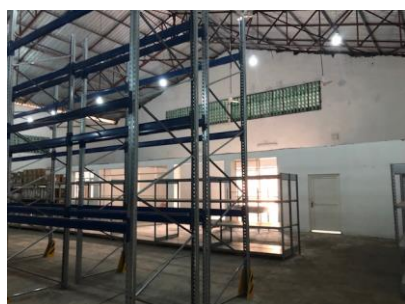
Locaux de stockage dans la nouvelle CDR