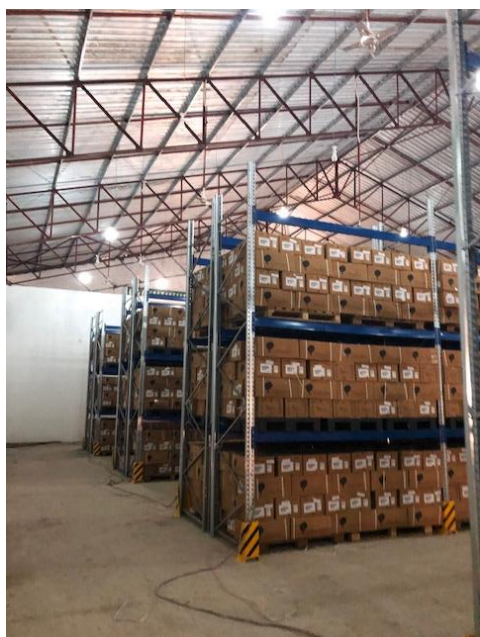
Stockage de médicaments dans la nouvelle centrale

La partie mise en œuvre du projet s'est achevée avec succès avec la finalisation de la construction de la CDR et l'opérationnalisation de l'ASBL CADMESKI. La remise officielle de la Centrale de Distribution Régionale à la Province fut célébrée lors d'une cérémonie en présence du Gouverneur du Sud Kivu. Tous les équipements techniques, informatiques et le mobilier ont pu être livrés et installés dans la Centrale, permettant de stocker et de gérer un premier lot de médicaments. Ces derniers ont pu être achetés chez la CDR ASRAMES GOMA, Bureau de Coordination des Achats de la FEDECAME, qui assure l'approvisionnement des médicaments dans toutes les Provinces de l'Est de la RDC