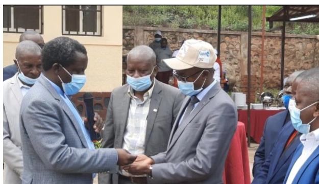
Remise officielle de la CDR le 12.05.2021 en présence du Gouverneur du Sud Kivu

L'accompagnement technique de la CADMESKI continuera à travers le Programme d'Appui au système de santé (PASS), financé par la Direction du Développement et de la Coopération suisse (DDC).