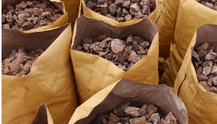
Minerais bruts pré-concassés à Chami