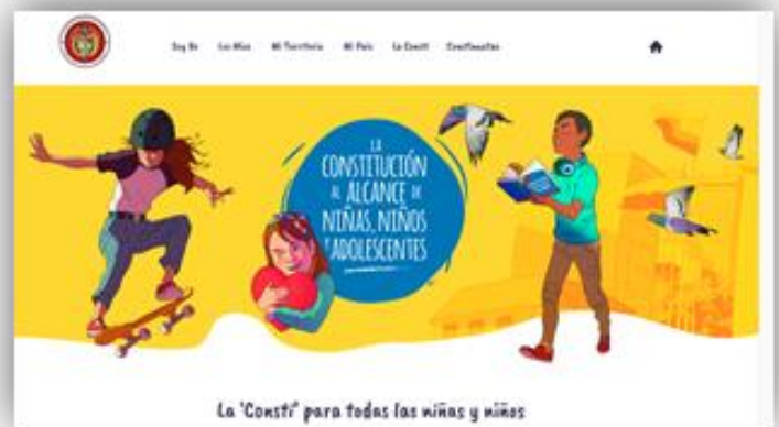
Fotografía: Micrositio web “La Constitución al alcance de niñas, niños y adolescentes”

En el marco del proyecto de la Corte Constitucional “La Constitución Política al alcance de niñas, niños y adolescentes”, la GIZ apoya la elaboración de un micrositio web específico para una audiencia joven dentro del sitio web de la Corte Constitucional, que se pondrá a disposición del público en el primer semestre de 2022.