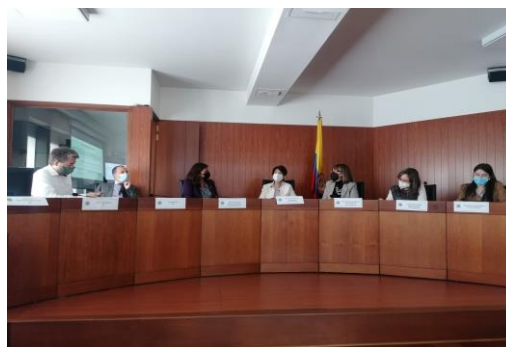
Fotografía: Tribunal, Corte Constitucional, Bogotá, 2021

En el marco del proyecto para el fortalecimiento institucional de la Corte Constitucional, se llevan a cabo las siguientes actividades: