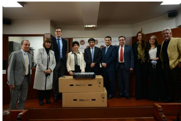
Fotografía: Donación de equipamiento de TI, Bogotá, 2022

El 4 de marzo de 2022 se entregaron a la Corte Constitucional servidores, licencias y discos duros de respaldo ( backup ) por valor de 450 millones de pesos colombianos (cerca de 100 000 euros) para la búsqueda de decisiones en formato electrónico de la Corte