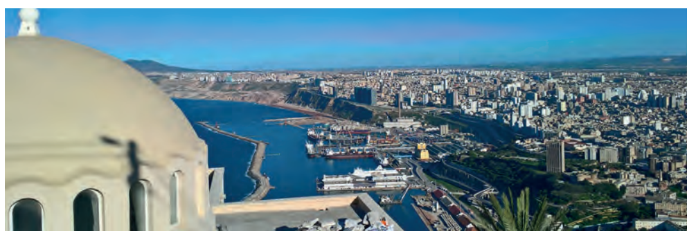
Vue sur la ville d'Oran, Algérie.

Au cœur du projet régional se trouvent les partenariats de projets entre les communes maghrébines et allemandes. Dans ce cadre, des expériences, bonnes pratiques et savoir-faire dans les domaines du développement urbain durable sont partagés. Avec des projets pilotes concrets, les partenaires apprennent mutuellement des expériences des autres, tant dans la mise en place des processus administratifs et techniques efficaces que