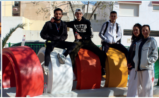
Gauche : Théâtre Municipal de Djerba Midoun - Tunisie, Janvier 2020.