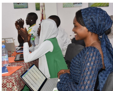
Suivi lauréats du CIEREE / Mise en place Bureau Alumni - Incubateur UASZ