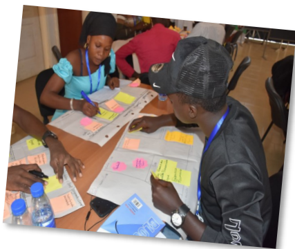
Idéation/Coaching en BMC - Incubateur UASZ