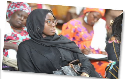
Lancement Projet « Jiggen Ci Energies » - Incubateur EPT - Incubateur EPT