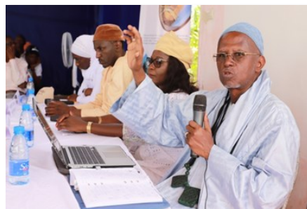
Journées portes ouvertes / Challenge - ISEP Richard Toll