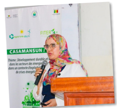
CasamanSun - FITER - Pitch Challenge - UASZ