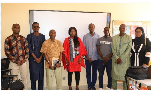
Journées d'opportunités/Formation en Entrepreneuriat et usage productif des ER - ISEP Bignona & RISEP