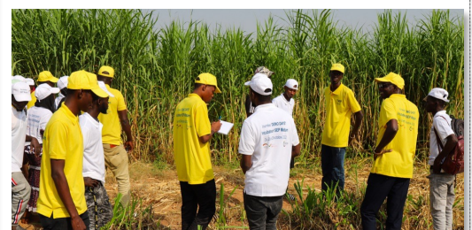
Démo Day - ISEP Matam