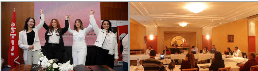
Photo à gauche : les quatre présidentes des consortiums d'entreprises gérées par des femmes le jour de l'événement de lancement des G.I.E

sont aujourd'hui assez actifs sur les marchés de l'Afrique subsaharienne et exploitent pleinement le potentiel de ces marchés. Ils sont également accompagnés dans la mise en œuvre de leurs plans d'actions par l'équipe du projet.