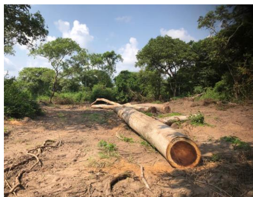
Photo de gauche : paysage forestier à Mankim, région Centre