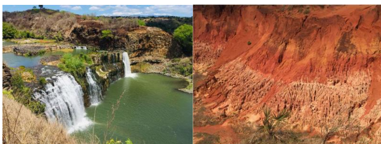
Photo de gauche : Paysage Bassin Versant Irodo : Cascade sur le lit de la rivière d'Irodo, dans le Fokontany d'Ambery - Commune rurale d'Anivorano-Nord, Région DIANA.

Le projet fait partie de l'initiative spéciale SEWOH "UN SEUL MONDE sans faim" du BMZ. Grâce aux projets de cette initiative spéciale, le BMZ contribue à la réduction de l'extrême pauvreté et la faim par la mise en place de plusieurs projets globaux touchant différents secteurs, dans le monde. L'accent est mis sur les thèmes suivants : sécurité alimentaire, résilience et sécurité alimentaire en cas de crise et de conflit, innovation dans le secteur agricole et alimentaire, mutation structurelle écologique et sociale en milieu rural, exploitation durable des ressources naturelles en milieu rural, garantie des droits fonciers. Cela intègre la restauration des paysages et des forêts et la bonne gouvernance dans le secteur