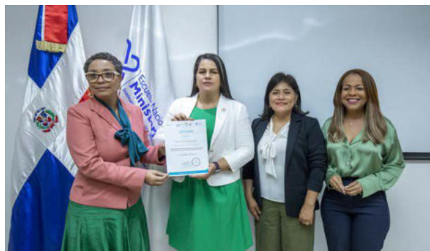
Clausura del curso de capacitación celebrado en la República Dominicana

Deutsche Gesellschaft für Internationale Zusammenarbeit (GIZ) GmbH Domicilios de la Sociedad Bonn y Eschborn, Alemania T +49 61 96 79-0 E info@giz.de I www.giz.de/en Lugar y año de publicación: Berlín, marzo de 2024