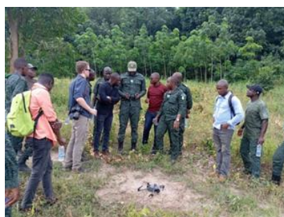
À gauche : Pépinière en Côte d'Ivoire À droite : Analyse des zones forestières restaurées par drones