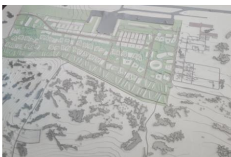
მ.მ.: საგ ზაო ინფრასტრუქტურა საქართველოში, ჰუმანიტარული და გადაუდებელი ოპერაციების ცენტრი მოზამბიკში