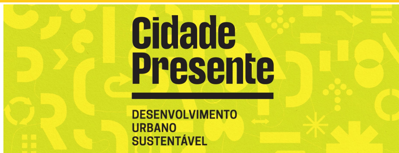
Imagem: logomarca e identidade visual do projeto Cidade Presente — Desenvolvimento Urbano Sustentável (DUS).

meio do desenvolvimento urbano integrado. O Projeto Cidade Presente – DUS se propõe a promover a boa governança, contribuindo para a coesão social.