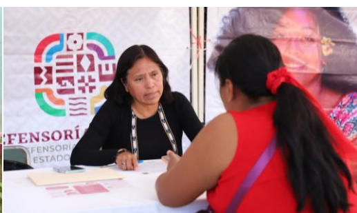
Imagen 1. Servicio a personas adultas mayores