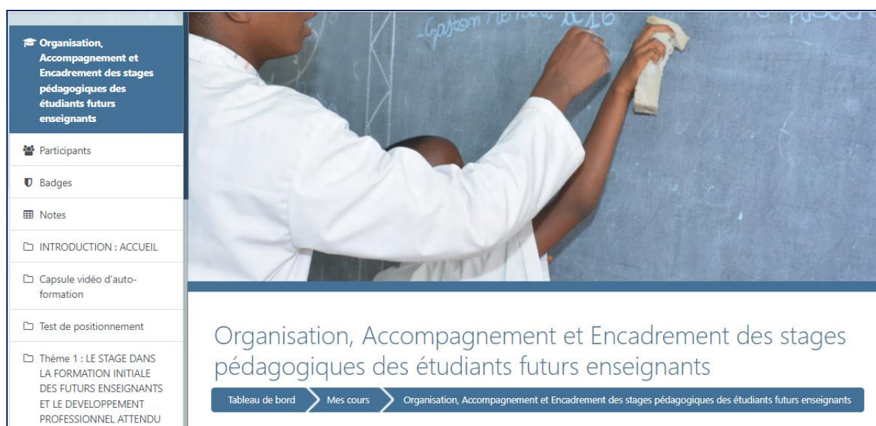
Figure 1. Interface du MOOC