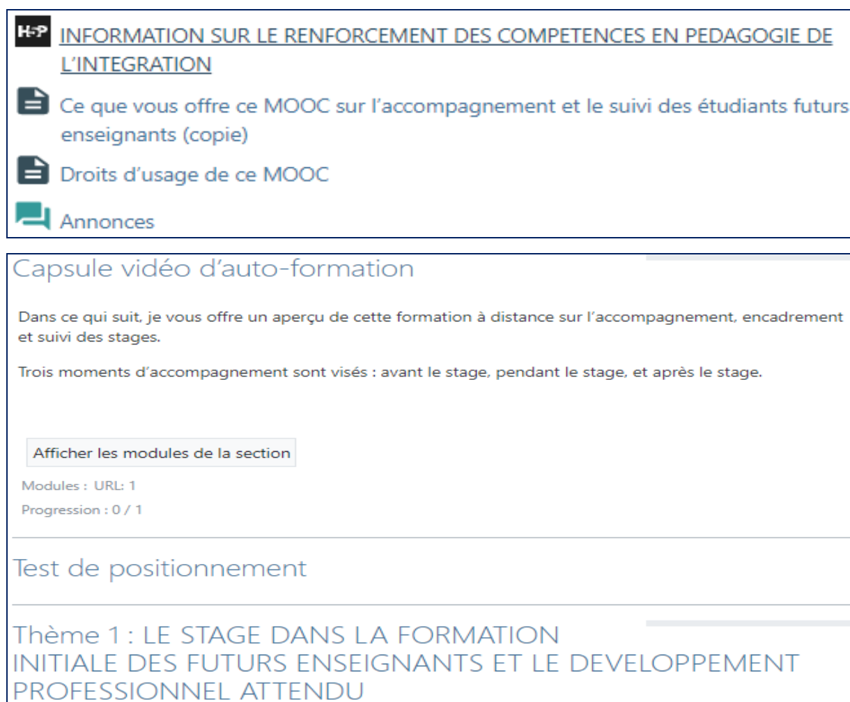
Figure 3. Activité du pré-test

La capture d'image ci-dessous, montre les ressources et activités mises en avant lors de la formation en ligne, notamment : les contenus interactifs H5P « HTML5 Package », les informations sur le contenu du MOOC, les droits d'usage, la capsule d'autoformation et le pré-test.