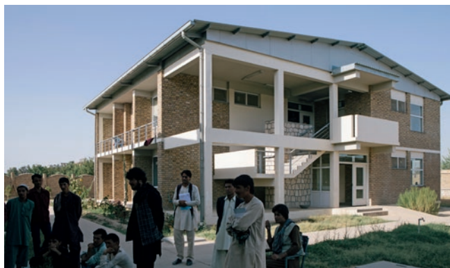
Die neu errichtete Höhere Schule für landwirtschaftliche Berufe in Kunduz

In der Provinz Takhar wird derzeit ein neues Berufsbildungsinstitut errichtet. Die ersten Berufsschüler können voraussichtlich zu Beginn des akademischen Jahres 2017 den Unterricht besuchen. Das Institut wird etwa 620 Studierende in den Bereichen Automechanik, Elektrik, Maschinenbau, Installation, Verwaltung, Rechnungswesen, Handel und IT ausbilden können.