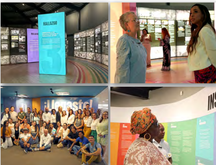
Exposición 'Hay Futuro Si Hay Verdad, de la Colombia Herida a la Colombia Posible', legado de la Comisión de la Verdad (CEV). Valle del Cauca, Cali ©GIZ Colombia.