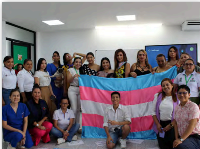
Corporación social LibeTrans, nace a partir de las necesidades de personas Trans en la búsqueda de una vida digna y libre de violencias.