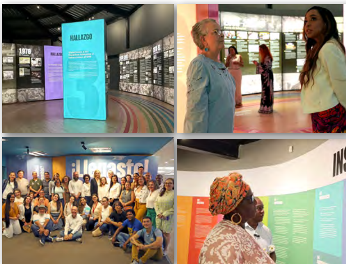
Exposición 'Hay Futuro Si Hay Verdad, de la Colombia Herida a la Colombia Posible', legado de la Comisión de la Verdad (CEV). Valle del Cauca, Cali