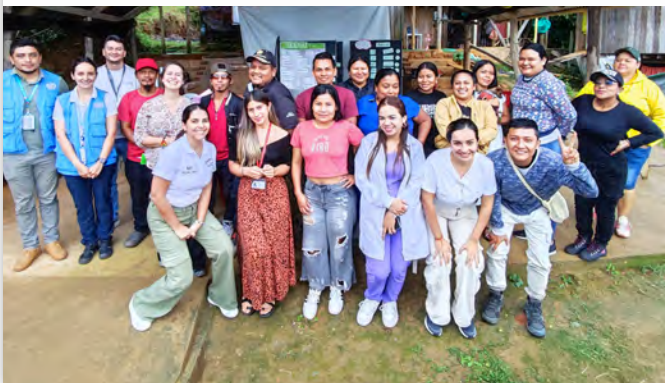
Fortalecimiento de capacidades de la Asociación de Indígenas Korevaju Desplazados ASINKODE.