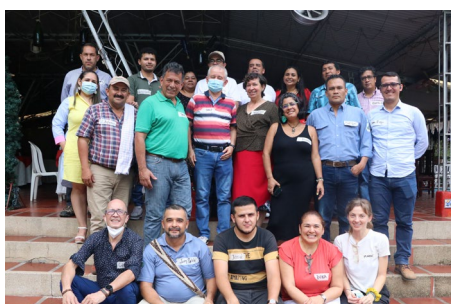
Foto: Taller Gobernanza Forestal, Florencia

El proyecto ProBosques apoya al Ministerio de Ambiente, Ministerio de Agricultura y Autoridades Ambientales regionales en reducir la deforestación impulsando el Manejo Forestal Sostenible en las regiones de Meta y Caquetá trabajando con usuarios del bosque e implementando acciones para que se beneficien del uso sostenible a través del: i) fortalecimiento de las cadenas de valor de productos maderables y no maderables del bosque natural, ii) mejorando la gobernanza forestal y iii) mejorando el marco legal, institucional y financiero para el manejo forestal sostenible.